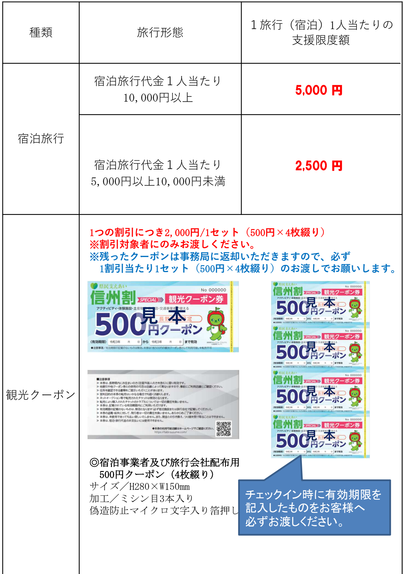
表1 1人1宿泊旅行あたりの支援額（割引額）早見表