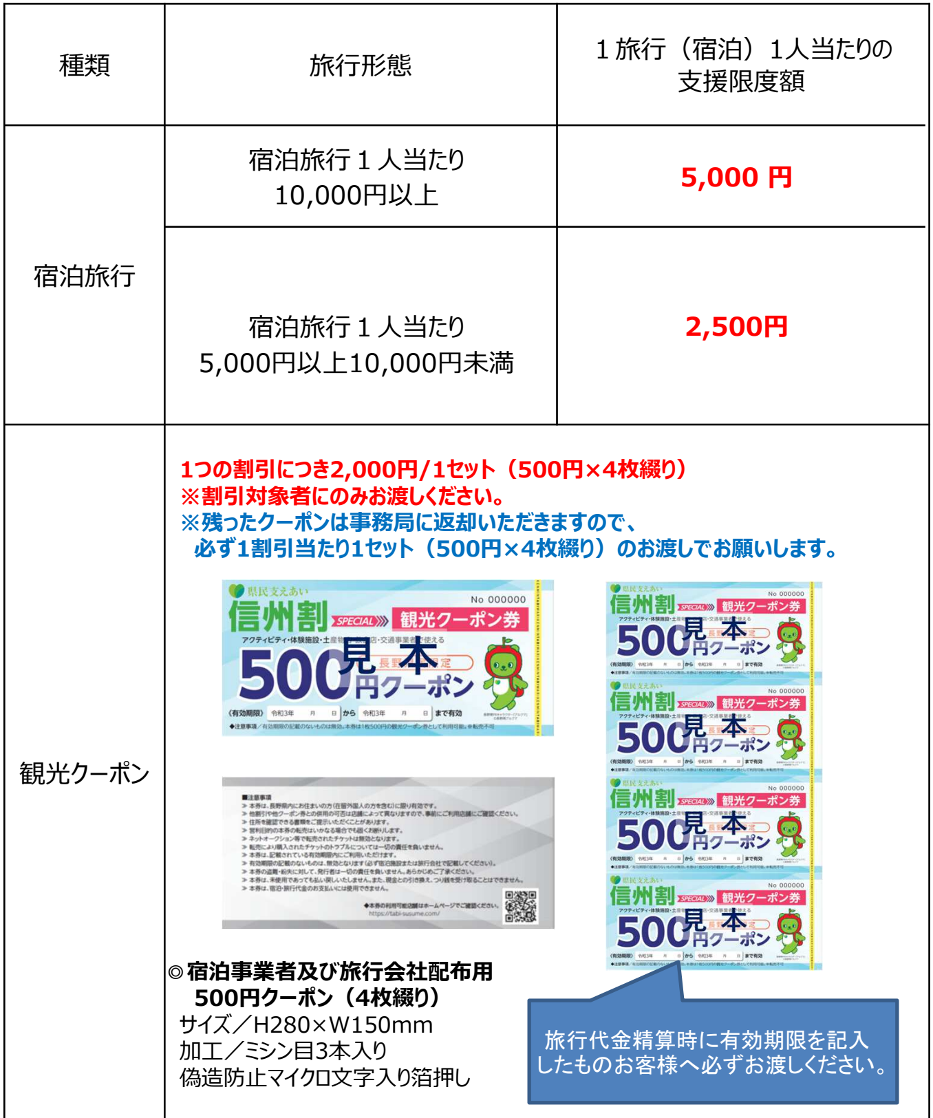
表1 1人1宿泊旅行あたりの支援額（割引額）早見表